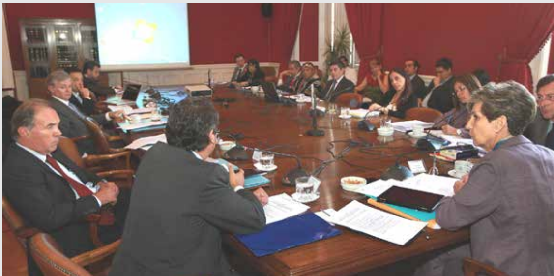
Sesión Comisión Minería y Energía.

Son grupos de trabajo compuestos por 5 senadores o por 13 diputados en los que se revisan, discuten y votan en detalle los proyectos de ley, los cuales después se informan a los demás parlamentarios en las sesiones de Sala. Existen 24 Comisiones permanentes en la Cámara de Diputados y 20 en el Senado.