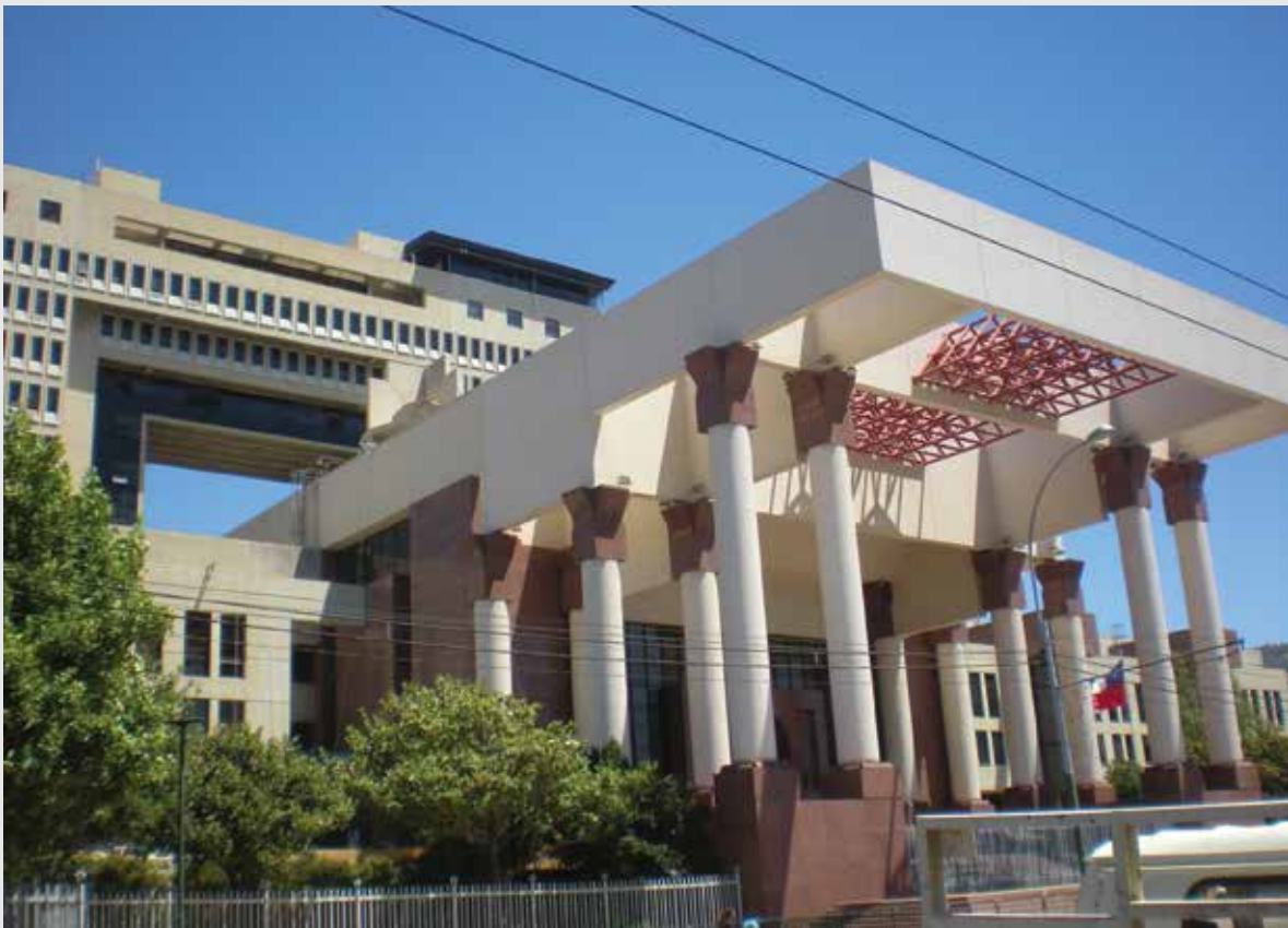
Congreso Nacional de Valparaíso.

El Parlamento está compuesto por dos cámaras: la Cámara Alta, denominada Senado y la Cámara Baja, denominada Cámara de Diputados.