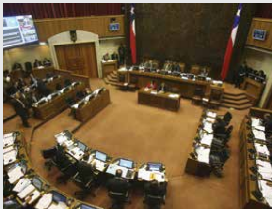
Sesión Sala del Senado.