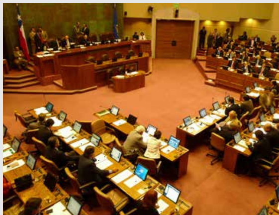
Sesión Sala de la Cámara de Diputados.

Para el sistema de votaciones, se hace una distinción entre los parlamentarios en ejercicio de cada Cámara (38 senadores o 120 diputados respectivamente) y los parlamentarios presentes en las sesiones en Sala, determinando quórum específicos para distintos tipos de leyes